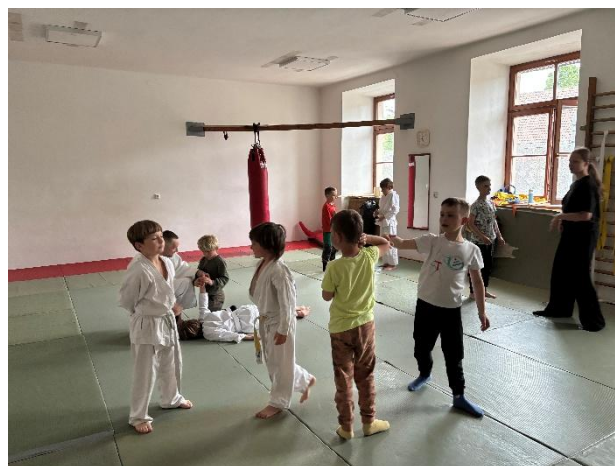
ZÚ - Jiu-jitsu