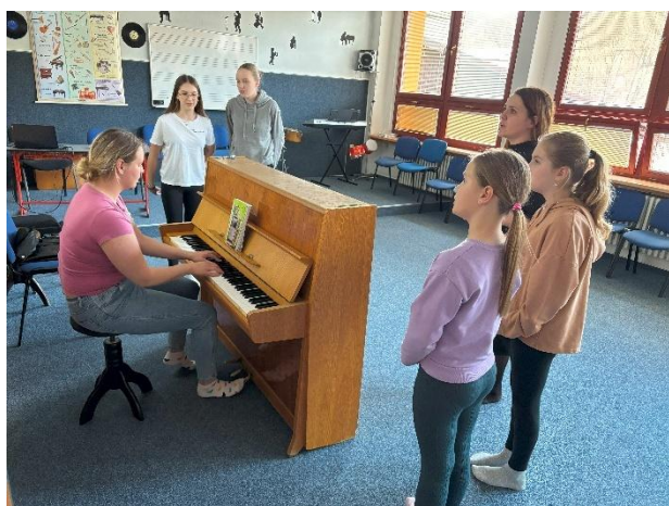
ZÚ - Sborový zpěv