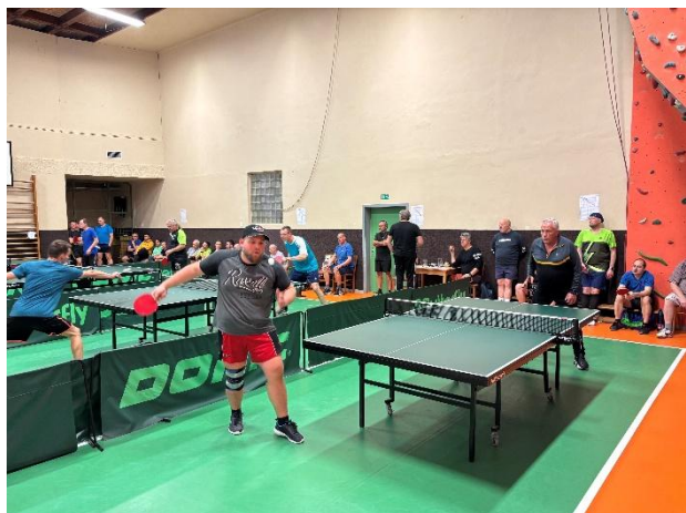
MEZINÁRODNÍ TURNAJ VE STOLNÍM TENISE