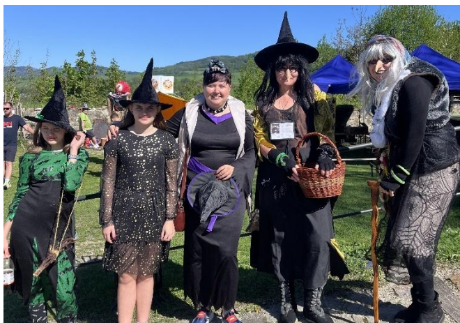
ČARODĚJNICKÉ ODPOLEDNE NA HRADĚ