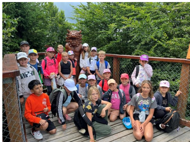
PŘÍŠERKY s. r. o.