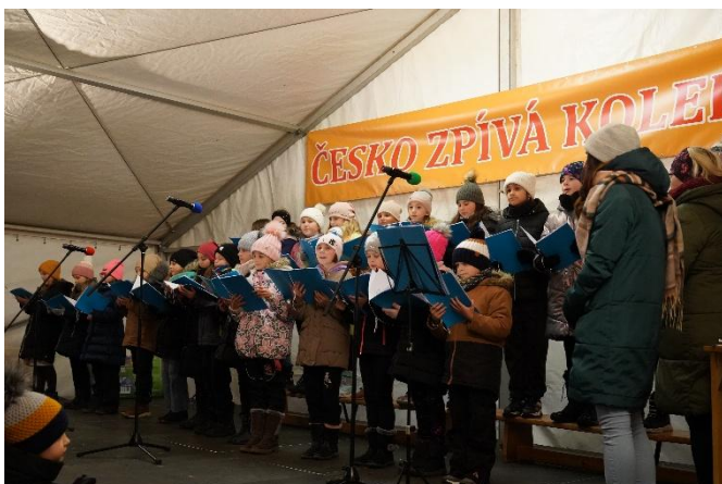
ČESKO ZPÍVÁ KOLEDY