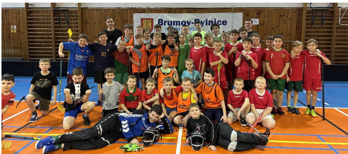
Přátelské utkání florbalových ZÚ DDM z Brumova-Bylnice a Nedašova