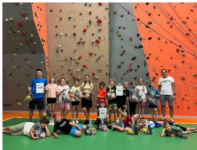
SPORTÁČEK ANEB SPORTUJEME PRO RADOST