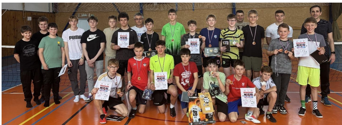
VELIKONOČNÍ NOHEJBALOVÝ TURNAJ ŽÁKŮ